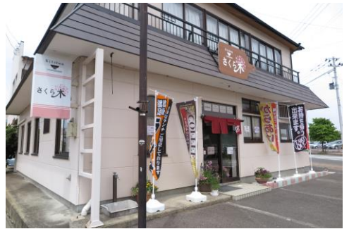
JR 鏡石駅前にオープンしたさくら木 定休日 毎週月 第三日曜日