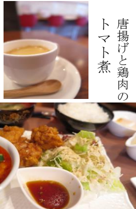
唐揚げと鶏肉の トマト煮 嬉しい事に食後に コーヒー付き

ております。当店からは歩いて数分と近いせいもあって何度かお伺いしましたが季節によりメニューの内容が変わるなど飽きさせない工夫もされております。また、土日限定ですがモーニングメニューが用意されており散歩の途中など気軽に立ち寄りやすいです。さて、肝心の味ですが高級な家庭の味、濃すぎずあっさりとして、それでいて旨い。何よりごはんが美味しく大盛り飯のボリュームには驚きます