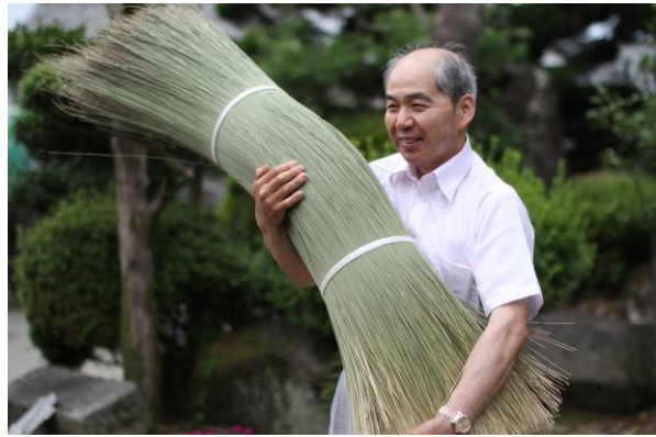
当店独自の昔ながらの製法で栽培乾燥された畳表はとても爽やかな香りです（畳表の原草）

さて、旅の楽しみと言えやはり食べ物でしょう。今回は佐賀県から福岡久留米へ移動しご当地名物の鰻料理、この久留米の鰻料理はセイロ蒸し、初めて食べましたが正に絶品。蒸したてのセイロの蓋を取ると何とも言いがたい鰻の香りが立ち込め、さらに、鰻のタレが滲みだした熱々の蒸し米が実に旨い。日本人で良かったとしみじみと感じながら鰻を頬張る私でした。もう一度食べた鰻料理。